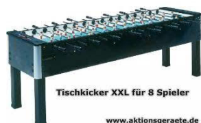
Tischkicker XXL für 8 Spieler