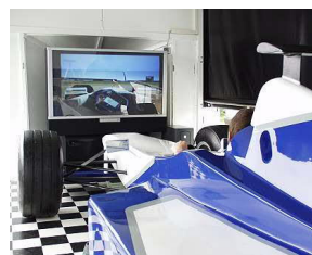
Formel 1 Simulator