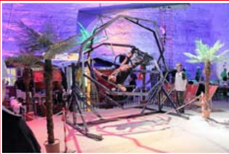
Astronautentraining im Aerotrim