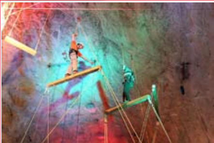
Spannende Teamübungen in ungewöhnlichem Umfeld...