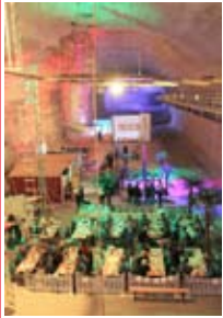
Imbiss bis 150 Personen