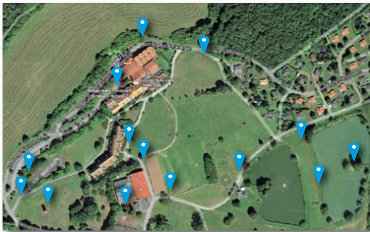
Beispiel einer Schnitzeljagd