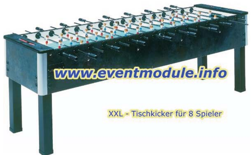
XXL - Tischkicker für 8 Spieler

Badestube 12 36251 Bad Hersfeld Tel.: 06621 / 78176 Fax: 51610 Mail: office@hollstein.de www.eventplaner.de www.showartisten.de www.attraktionen-news.de